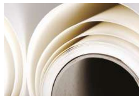
Hoja Grano Fino