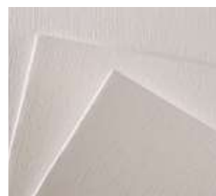
Grano Lienzo de Lino