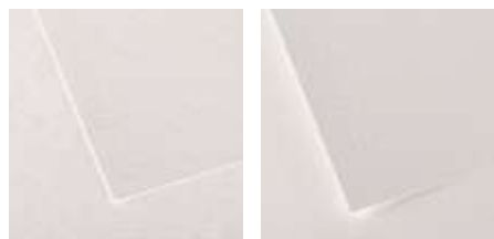
Hoja Grano Nube